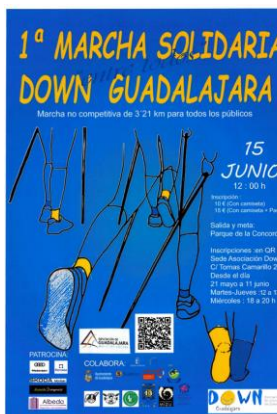
Cartel anunciador de la primera Marcha Solidaria por el Síndrome de Down 2024

Inscribiéndote en nuestra marcha y difundiéndola entre tus amigos. Haciéndote socio o voluntario de nuestra asociación. Como patrocinador de esta marcha.